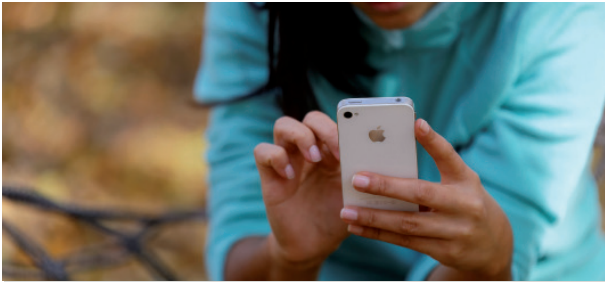
علاج أعراض الاكتئاب بمساعدة تطبيق هاتف ذكي على هواتف iPhone الذكية (برنامج الخدمة الذاتية)