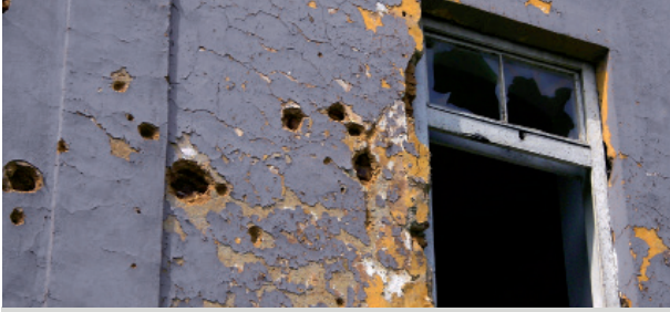
علاج نفسي عبر الانترنت لاضطراب ما بعد الصدمة النفسية