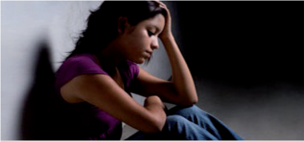
علاج نفسي عبر الانترنت لعلاج حالات الاكتئاب